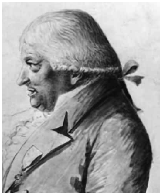
François-Joseph Gossé, dit Gossec