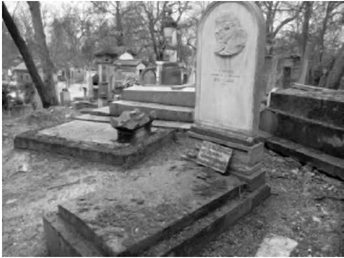
Tombe de Gossec au Père Lachaise